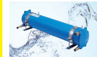
飲料水貯留システム〔24ℓ〕