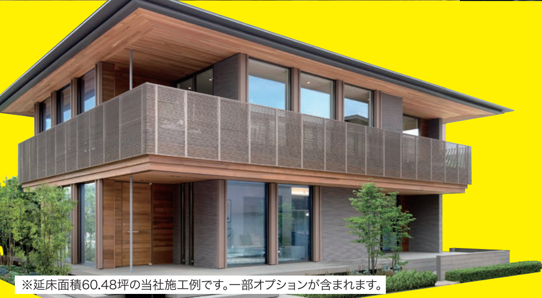
※延床面積60.48坪の当社施工例です。一部オプションが含まれます。