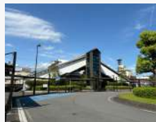
JR身延線「富士宮」駅 約1500-1580m 徒歩約19-20分

ショッピングモールや、スーパー、コンビニ、ドラッグストアなど多彩な店舗や公共施設に加え、緑に触れるスポットも身近に揃う、恵まれた住環境です