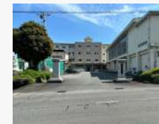
富士宮第三中学校 約1300-1380m 徒歩約17-18分