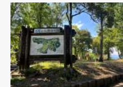
白尾山公園 約1600-1680m 徒歩約20-21分